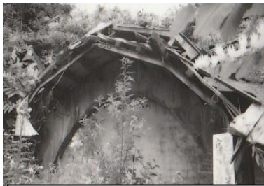
事故を起こした旧一鉢坑口

一九六一年(昭和39)九月以降、当時の炭労は「政策転換」を求め、全国から炭鉱労働者を東京へと大動員をかけます。夕炭労は「職場にたたかいていますが、やはりたたかいは基本は現場にあるのです。」