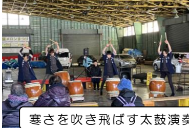
寒さを吹き飛ばす太鼓演奏