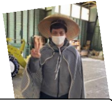
寒太郎あらかわる！

10時開会に合わせて、主催者と市長より開会あいさつが。その後は夕張太鼓「竜花」の迫力の音が会場いっぱいに響きました。会場は焼き芋やカレー、豚汁が販売され大賑わいでした。