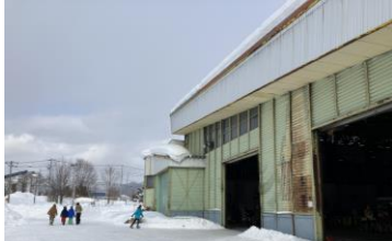
会場に駆け寄る親子連れ