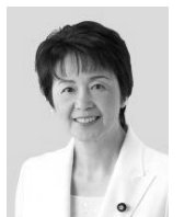
紙智子「国会かけある記」 参議院議員