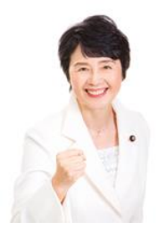
紙智子「国会かけある記」 参議院議員 紙智子

*「日本の戦争はなんだったのか」188頁・吉岡吉典 著 * 樺太は、一八七五年(明治8)日口間の「樺太・千島交換 条約」によってロシア領になっていた。 日露戦争の結果、樺太の南半分を日本が領土とした。