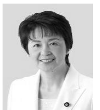
紙智子「国会かけある記」 参議院議員

それをさらし首にし採集するなどは、まさに人間への冒とくであり、ことは人間の尊厳にかかわる問題です。