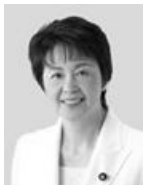
紙智子「国会かけある記」

「今回の要求条項の主意ある処はよく諒解せり。これらの条項は、 支店長を信頼して支店長に一任せよ。尚今回の登川、楓両鉱の事件 が円満に解決し、労働者が静穏に稼働するならば、この際に限り運 働者の責任は問わざること。」という内容でした。